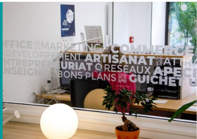
VILLE DE THIONVILLE

L'Office du commerce, de l'artisanat et de l'entrepreneuriat de Thionville, fondé le 17 décembre 2020 a inauguré ses locaux le 2 juillet 2021, place Anne Grommerch. La CMA 57 est un des membres fondateurs de cette structure qui découle de l'action Cœur de ville et d'une fructueuse collaboration entre acteurs économiques et politiques locaux. Lieu d'information, de concertation et d'échanges pour les entreprises et les porteurs de projet, l'Office intervient au service de l'attractivité du territoire alors que Thionville affiche un taux de vacances inférieur à 15 %.