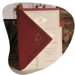
Ouardia Cazzulani Imprimerie Mos

Créée depuis 2019, cette imprimerie traditionnelle, dite "letterpress" s'adresse principalement aux particuliers et imprime faire-parts, cartes de visite mais aussi des abat-jours.